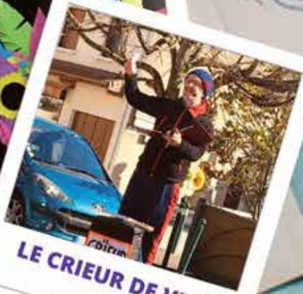
LE CRIEUR DE VLM

AVEC : LE CLUB DES JEUNES LA CLASSE EN 3 LES COMMERÇANTS LE COMITÉ DES FÊTES LA MAIRIE DE VLM LES ÉCOLES